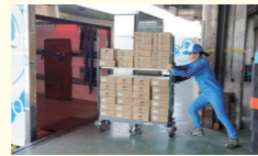
配車室で行先確認、積み込み。その後店舗へ出発。午前中は2軒の店舗へ配送。