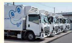
回収した荷物を下してトラックを洗車後、車庫へ