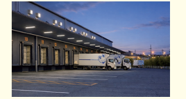
回収した荷物を下して車庫へ。自家用車に乗り換え、配送センターへ移動。