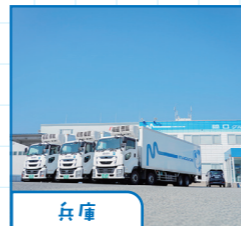
兵庫 神戸市東灘区 西宮市