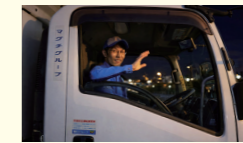
最後の1軒の積み込みをし、出発。