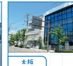
大阪 大阪市港区(本社) 大阪市住之江区 堺市堺区 和泉市 枚方市